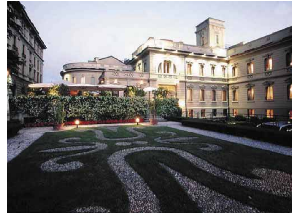
Sopra, l'Albergo Terminus, sotto, la Sala Venezia,

Caffè-restaurant "Bar delle Terme" Where Prestige is at Home